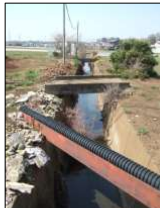
畑中を走る はげ下堀