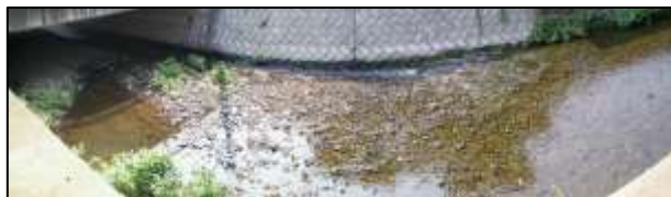
こんな所にも水たまりが